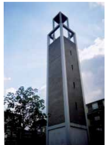
9 - 13 jaar - 3e prijs - Luna v.d. Ven