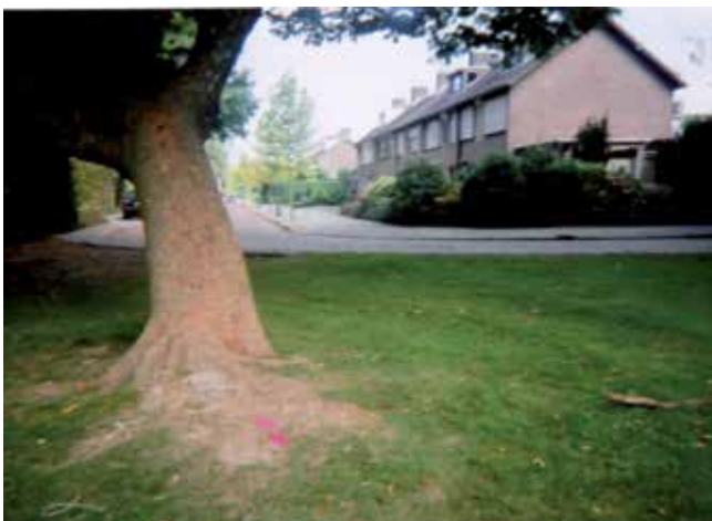
5 - 8 jaar - 2e prijs - Maartje Kantelberg