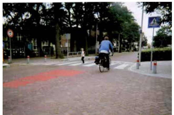
Eervolle vermelding - Kirsten Jonkers