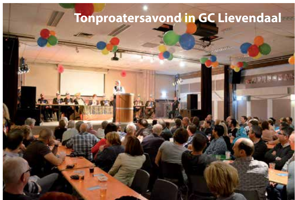
Tonproatersavond in GC Lievendaal