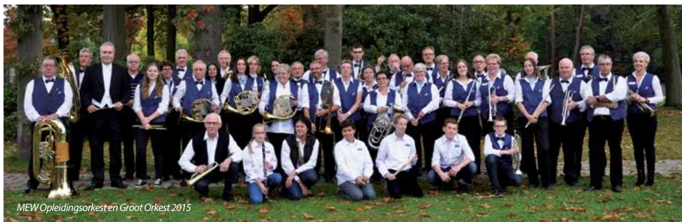
MEW Opleidingsorkest en Groot Orkest 2015

Muziekvereniging Eindhoven West Opgericht 21 juni 1945