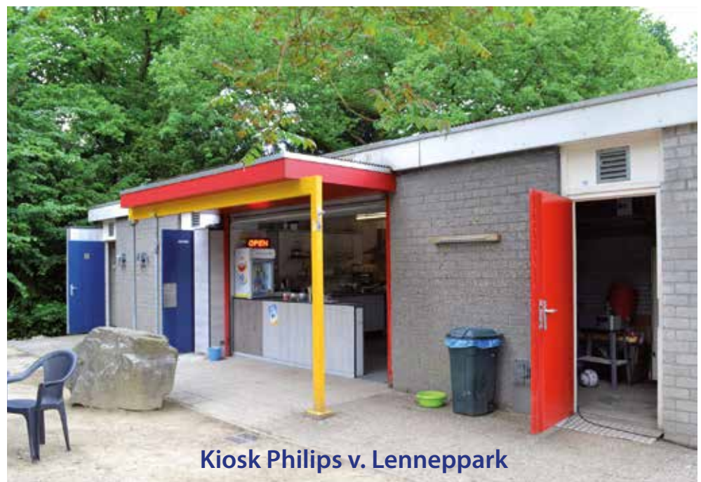
Kiosk Philips v. Lenneppark